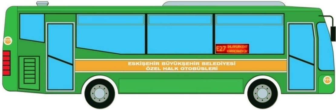
( BELEDİYE HALK OTOBÜSÜ SAĞ YAN GÖRÜNÜŞ )