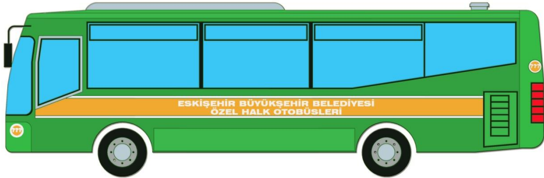
( BELEDİYE HALK OTOBÜSÜ SOL YAN GÖRÜNÜŞ )

OTOBÜS YAN ŞERİTLERİ 23 cm FOLYO ÜZERİNE 3'er cm BEYAZ KUŞAKLAR ARASINDA 17 cm TURUNCU KUŞAK OLACAKTIR. HARFLERİN YÜKSEKLİĞİ 7 cm OLACAK, YAZI TİPİ ARIAL KULLANILACAKTIR.