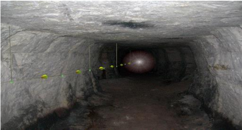
Şekil-1: Hayat hattı görünümü

18. (Ek:RG-10/3/2015-29291) (3) Yeraltı madenlerinde, hazırlık faaliyetlerinin yapıldığı alanlar ve üretim panoları gibi yeraltı maden işletmesinin bütün bölümlerini kapsayacak şekilde ve çalışanların yerüstüne çıkmalarını kolaylaştıran; yanmaya, kopmaya ve aşınmaya karşı dayanıklı bir hayat hattı kurulur (Şekil-1 ve Şekil-2). Bu hatlar acil durum planlarına uygun olarak yerleştirilir.