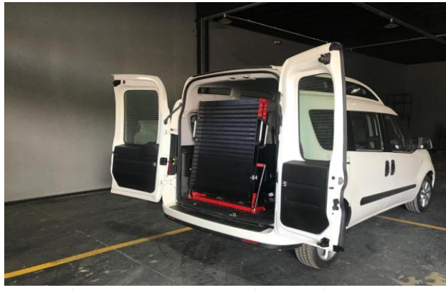
Engelli Rampası araç bagajı yerleşim görüntüsü