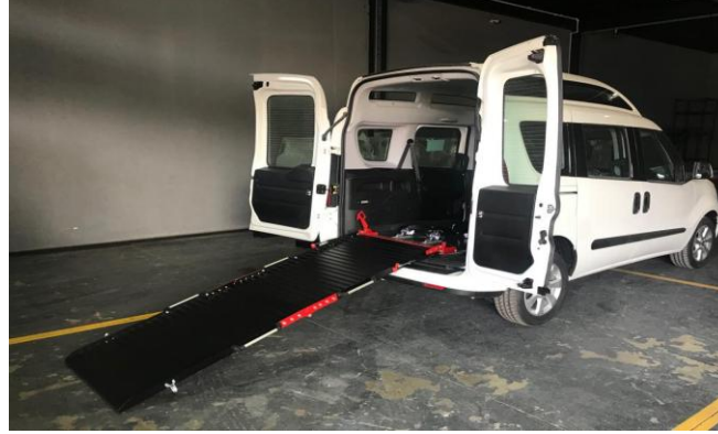
Engelli Rampası açık konum görüntüsü