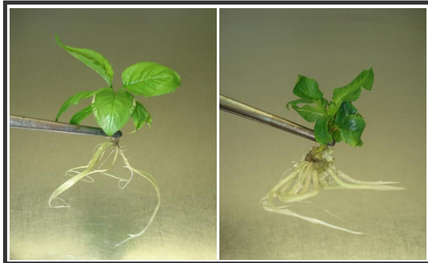
Şekil 4.10. Farklı içerikli besi ortamında köklendirilmiş kiraz bitkileri (a: 0.5 mg l -1 IBA; b: 0.5 mg l -1 NAA)